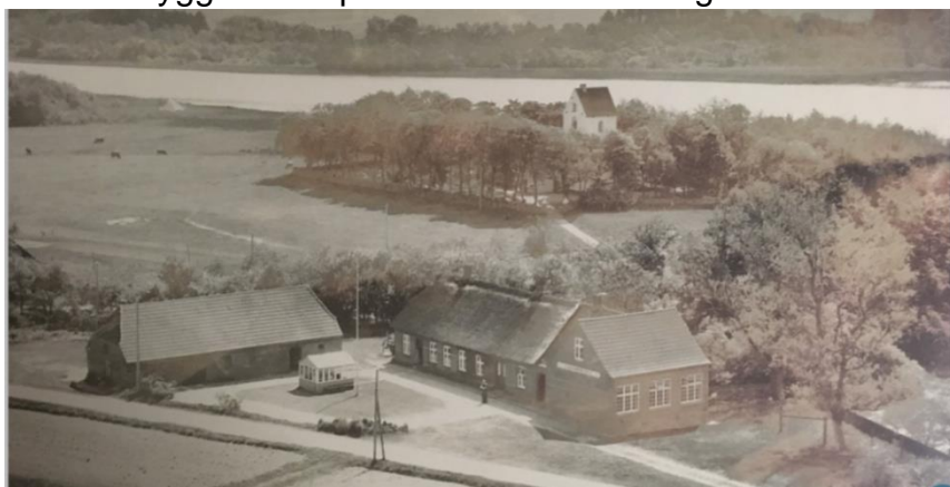
Landsbyskolen i Bigum i 1950erne, tæt ved kirken og søen.

Vi, der kom jævnligt på kirkegården, har aldrig opfattet kirken som isoleret. Den gamle, nu nedbrændte, landsbyskole lå lige ved kirkestien, og med blot et gadekær imellem ligger kirken direkte overfor de sidste huse i Bigum by og tæt ved Forsamlingshuset. De nærmeste naboer til kirken måtte i 1952 acceptere fredning af arealer nord og vest for kirken for ikke at ødelægge udsynet til kirken og den smukke placering i landskabet. Der må ikke bygges eller plantes stor bevoksning.