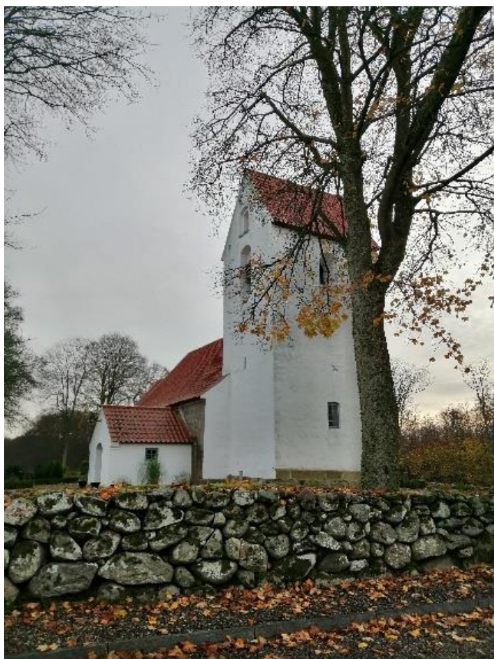
Bigum kirke, fotograferet november 2020 af forfatteren.