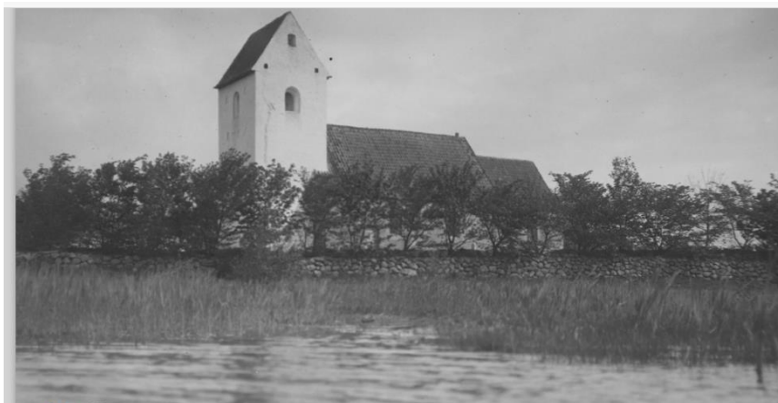
Bigum kirke 1910-1930.