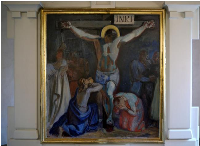
Altertavlen i Bigum kirke: "Kvinderne ved korset", 1945. Kunstneren er Stefan Viggo Pedersen.