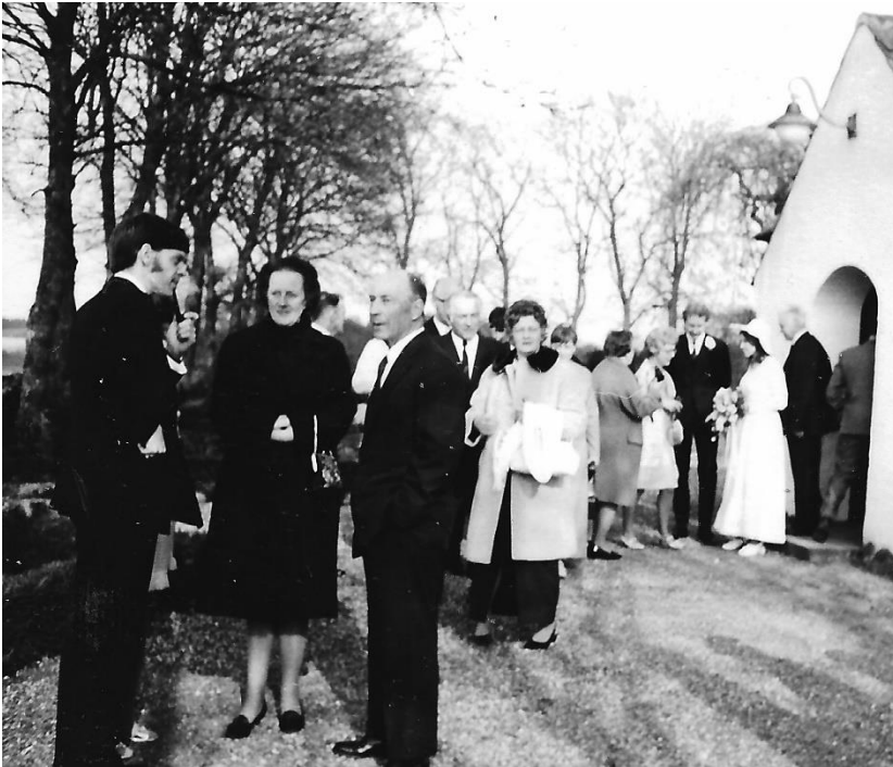
22. april, 1972, Vi kommer ud fra kirken, Far står i dørbåbningen, lige bag mig