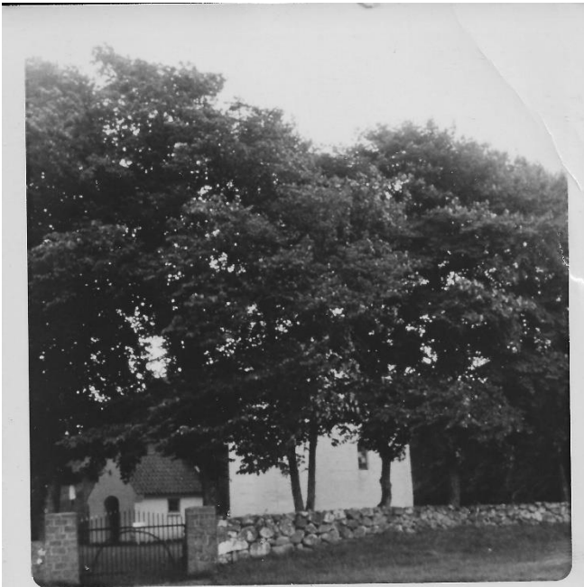
Bigum kirke med nogle af de store træer, der smed så mange blade, ca. 1960.